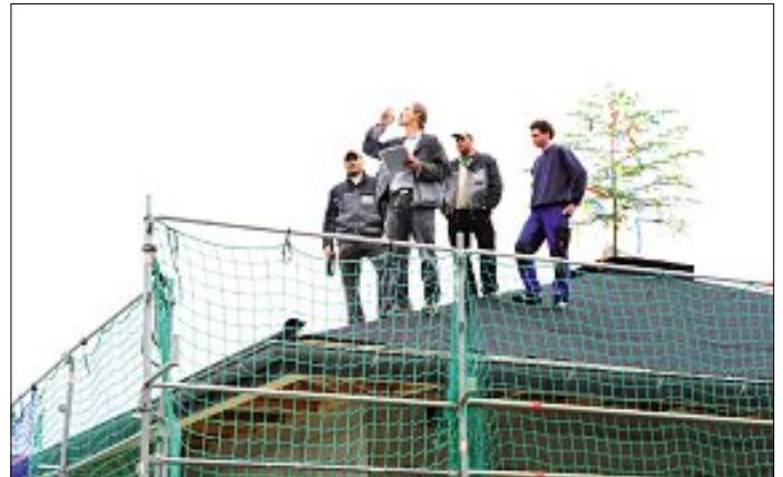
Ein Prosit auf den Neubau