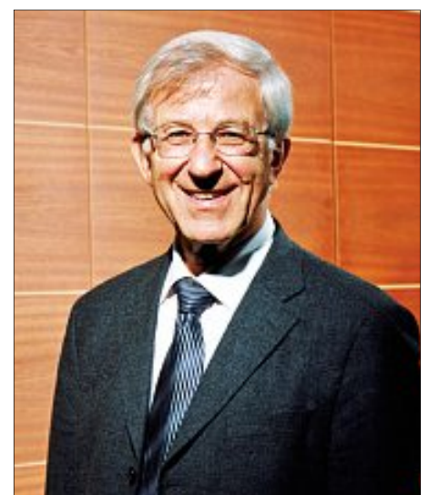
Franz Alt kommt in die Aula

Am Donnerstag, 13. Juni, um 19.30 Uhr wird sich der bekannte Fernsehjournalist Franz Alt mit dem Thema „Auf der Sonnenseite - Wie uns die Energiewende zu Gewinnern macht“ auseinandersetzen. Bereits ein Viertel unseres Bedarfs wird durch Öko-Strom gedeckt. Die Energiewende hat Deutschland zum Vorreiter alternativer Energiequellen gemacht. Doch warum sind wir immer noch von Öl, Gas, Kohle und Atomstrom abhängig? Franz Alt fragt danach, warum Lobbyisten weiter unter dem Schutz der Politik stehen und deckt in seinem neuen Buch auf, wer die Energiewende bremst und warum sie dennoch alternativlos ist. Der Fernsehjournalist und langjährige Berater von Regierungen und Konzernen legt eine brisante Analyse vor, die Lobbyisten, Energiemultis und Politikern nicht gefallen wird.