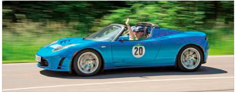
Auch sportliche Flitzer waren dabei