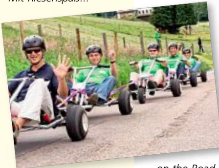
...on the Road

Eine Rallye? Das sind röhrende Motoren und quietschende Reifen. Denkste – ganz anders war der Start der 2. ENCW Schwarzwald E-Rallye am Unteren Ledereck. Leise, beinahe geräuschlos begab sich ein Elektroauto nach dem anderen in Position. Insgesamt waren ca. 30 Gefährte, die sich aufmachten, die 200 Kilometer lange Tour durch die Landkreise Calw, Freudenstadt und Böblingen in Angriff zu nehmen. Auf der Strecke gilt es, mit den Stromreser-