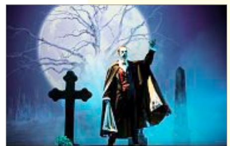
Phantom der Oper