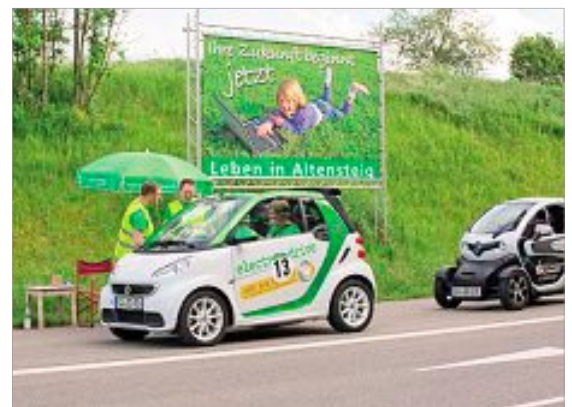
An der Etappenkontrolle