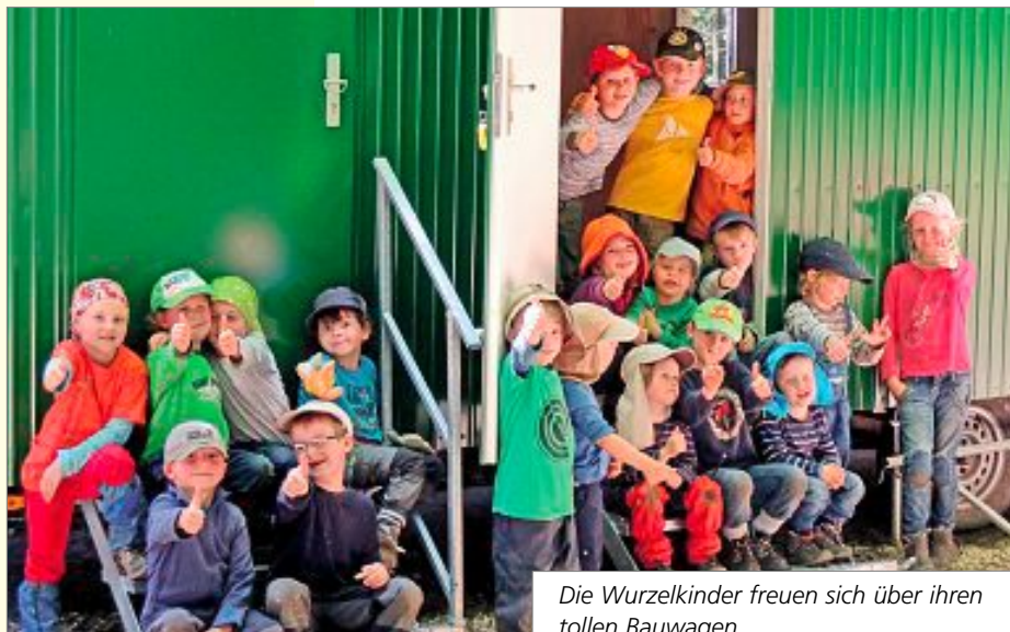
Die Wurzelkinder freuen sich über ihren tollen Bauwagen

Auf das diesjährige Waldfest des Calwer Waldkindergartens (zwischen Stammheim und Holzbronn) dürfen sich Groß und Klein am kommenden Sonntag, 23. Juni, freuen. Das 14. Waldfest, mit dem von 12 bis 17 Uhr auch das 15-jährige Bestehen des Vereins gefeiert wird, beginnt um 12 Uhr mit der offiziellen Eröffnung, im Anschluss wird auch noch die Ganztagesbetreuung mit Oberbürgermeister Ralf Egert eingeweiht.