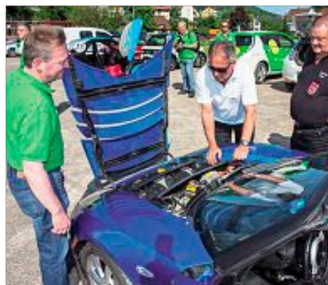
Ein Elektromotor im Blick