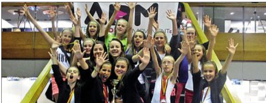
Die Kool Kixx sind Deutscher Meister der Juniors 1

Die Stadtkapelle Calw lädt zu ihrem 4. Serenadenkonzert 2013 ein. Am Freitag, 5. Juli, kann jeder kommen und sich ab 20.30 Uhr im Hirsauer Kurpark von Melodien verzaubern lassen. Der Kurpark wird dafür mit Fackeln beleuchtet sein und mit Lichteffekten veredelt. Sollte das Wetter an diesem Abend nicht mitspielen, findet die Veranstaltung im Kurhaus statt. Die Bewirtung während des Serenadenkonzerts übernimmt der Förderverein der Stadt- und Jugendkapelle Calw. Die Stadtkapelle freut sich auf zahlreiche Gäste.