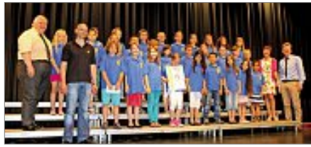
Der Chor der Zellerschule Nagold

Bei ihren Auftritten hatten die Kinder die Gelegenheit den Zuhörern zu beweisen, dass sie ihren Platz auf dem Siegertreppchen verdient