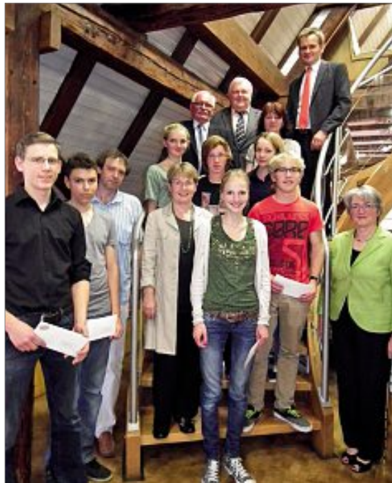
Die Calwer Bundespreisträger von „Jugend musiziert“ wurden im Casino der Sparkasse geehrt