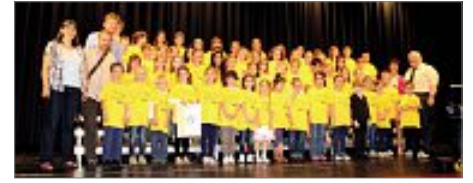
Der Chor der Lembergschule Nagold

haben. Sie gestalteten ein tolles musikalisches Programm mit originellen Liedern.