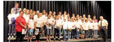
Der Grundschulchor aus Neubulach

● "Echt Gut": Ehrenamtswettbewerb der Landesregierung wieder ausgeschrieben