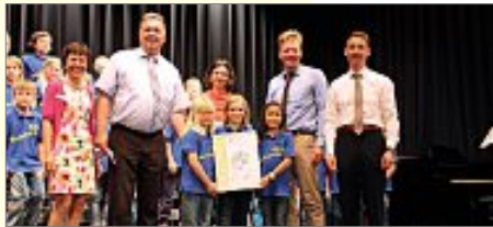
Der Chor der Markgrafenschule Altensteig

Wenn Kinder singen, dann können sie den Erwachsenen durchaus das Wasser reichen. Das zeigten vier Grundschulchöre am vergangenen Freitag in der Calwer Aula. Denn sie sind die Gewinner des 4. Chorwettbewerbs für Grundschulen im Landkreis Calw und bekamen beim Preisträgerkonzert ihre Preise verliehen.