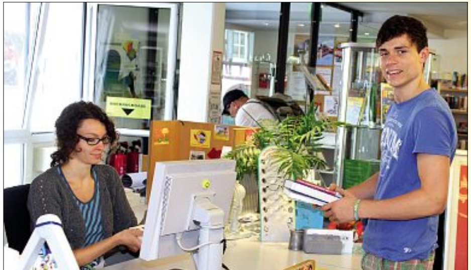
Archivbild: Blick in die Hauptstelle der Calwer Stadtbibliothek

Um für alle Sportvereine vergleichbare Rahmenbedingungen zu bieten, schlägt die Verwaltung vor, bei all ihren Räumlichkeiten ab dem 1. Januar ein Nutzungsentgelt von 5 Euro je Halle beziehungsweise Hallenteil und Stunde einzuführen. Für die neue Walter-Lindner-Sporthalle gilt dieser Tarif bereits. Für den Vereinsraum Altburg und den Dorfsaal Holzbronn soll das Entgelt 3 Euro pro Stunde betra-