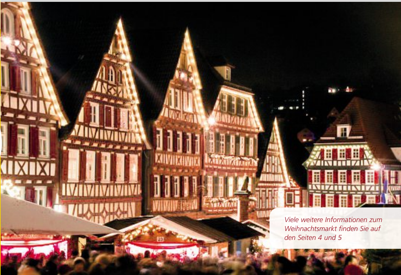
Viele weitere Informationen zum Weihnachtsmarkt finden Sie auf den Seiten 4 und 5