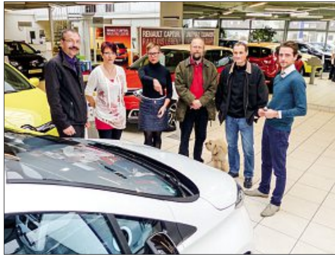
Vertreter aus Calw und Oberreichenbach holen das Fahrzeug ab

Kooperationsschule ist die Johann Georg Doertenbach-Schule Calw. Damit ist diese eine der wenigen Einrichtungen ihrer Art, die das