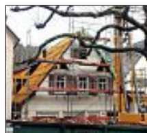
Der Kindergarten Schulgasse

Die Bauarbeiten am Kindergarten Schulgasse liegen voll im Zeitplan. Pünktlich vor den Feiertagen sind die neuen Dächer der beiden Gebäude winterfest gemacht worden. Die alten waren so marode, dass sie