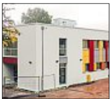
Das Kinderhaus Heumaden

Die baurechtliche Abnahme ist über die Bühne. Das bedeutet: Die Bauarbeiten sind erledigt, das Kinderhaus in Heumaden kann seine Pforten für die künftigen kleinen „Bewohner“ öffnen.