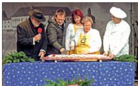
Oberbürgermeister Ralf Eggert zu Gast in Weida, der Calwer Partnerstadt in Thüringen

Der Weihnachtsmarkt wurde mit dem Anschneiden des Weihnachtsstollens, der dann im Weihnachtscafé zugunsten eines Sozialprojekts verkauft wird, eröffnet. Bürgermeister Beyer freute sich über das Calwer Gastgeschenk. Auf dem Weidaer Weihnachtsmarkt ergaben sich viele Gespräche mit den Bürgern.