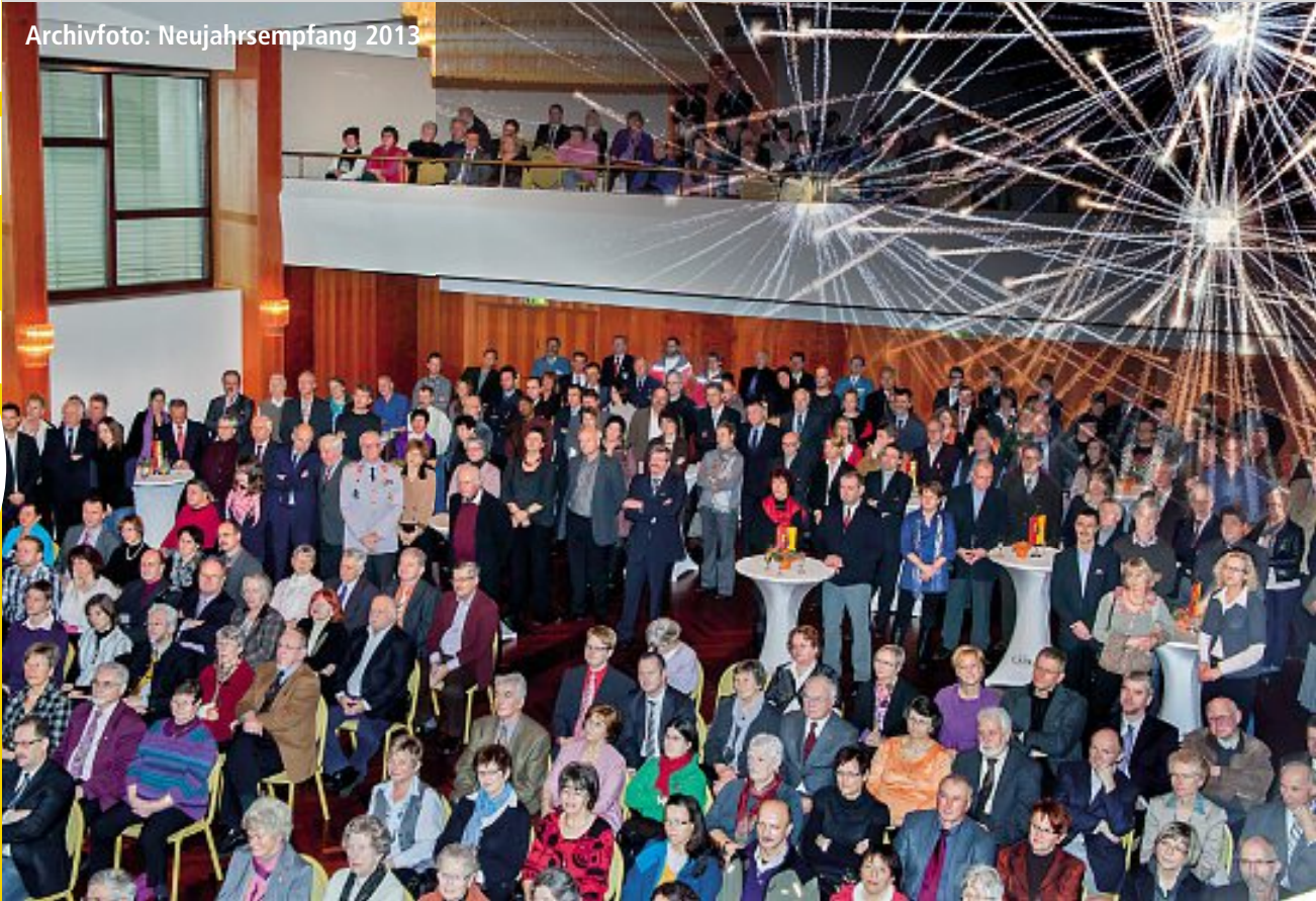
Archivfoto: Neujahrsempfang 2013