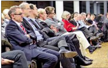
Zuhörer bei der Entscheidung im Kreistag

Außerdem soll die Verwaltung die Verhandlungen