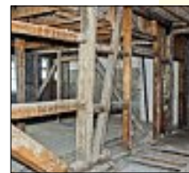
Innenansicht des Rathauses

Ende August hat Oberbürgermeister Ralf Eggert das Baugesuch für die Sanierung des Calwer Rathauses unterschrieben. Momentan laufen die Werk- und die Detailplanung. Parallel dazu wird das erste