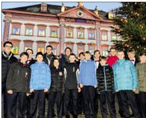
Die Aurelius Sängerknaben in Gengenbach