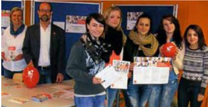
Schülerinnen und Lehrkräfte vom Organisationsteam am Informationsstand über die geplante Aktion