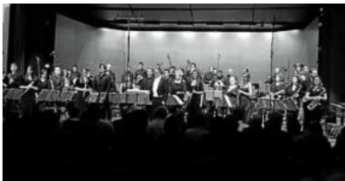
Bläserphilharmonie Baden-Württemberg mit Sebastian Manz

Die Stadtkapelle bedankt sich bei der Bläserphilharmonie Baden-Württemberg für eine musikalisch gelungene Woche.