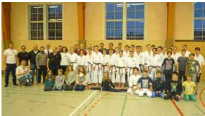
Erschöpfte aber zufriedene Gesichter beim ersten Landeskader-Training in unserem Dojo

Neue Anfängerkurse: Ab Montag, 17. März bzw. Dienstag, 18. März, finden wieder neue Anfängerkurse statt. Die Kinder starten bereits am Montag (17 Uhr); am Dienstag Jugendliche, Erwachsene (18.30 Uhr) und Senioren (19.45 Uhr).