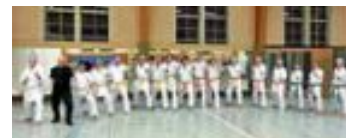
Für Karate ist man nie zu alt ... Unsere „Oldies and Goldies“