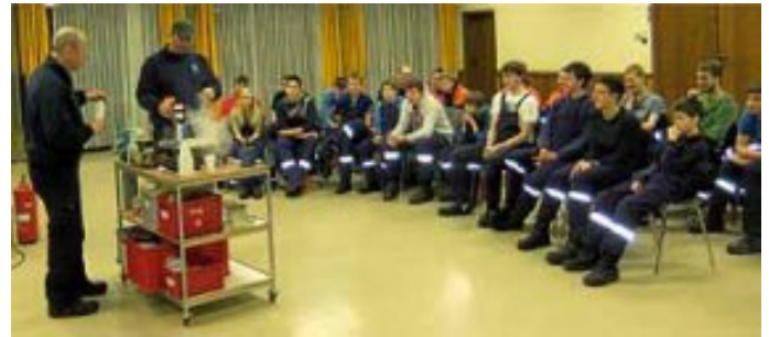
So macht Unterricht Spaß!