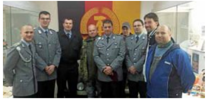
Im DDR-Museum in Pforzheim