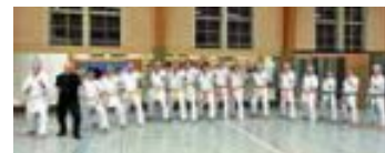
Für Karate ist man nie zu alt ... Unsere „Oldies and Goldies“