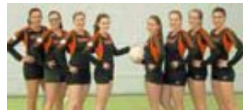
Als Nummer 1 der Bundesliga Süd zur deutschen Meisterschafts-Endrunde: die Frauen des TSV Calw.

Dennach - Calw 2:3 (11:13, 11:6, 11:9, 8:11, 5:11); Calw - Vaihingen/Enz 3:2 (14:12, 11:9, 3:11, 7:11, 11:7).