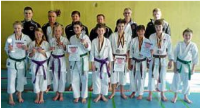
Unsere kleine aber feine Wettkampfgruppe zu Gast auf der miteldeutschen Meisterschaft in Bad König (Odenwald)

Neue Anfängerkurse: Ab Montag, 17. März bzw. Dienstag, 18. März, finden wieder neue Anfänger-Kurse statt. Die Kinder starten bereits am Montag (17 Uhr); am Dienstag Jugendliche, Erwachsene (18.30 Uhr) und Senioren (19.45 Uhr).