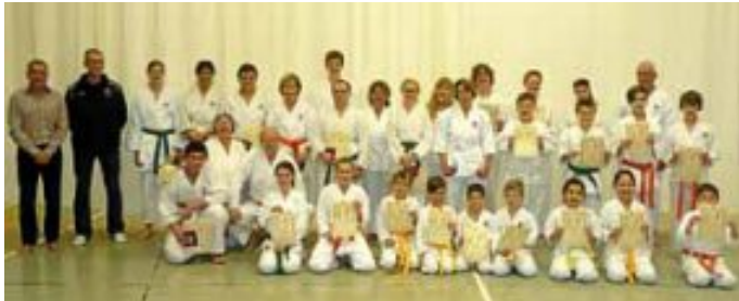
Gut vorbereitet - Prüfung glänzend geschafft!

Kinder ab 6 Jahre montags von 17 - 18 Uhr Jugendliche und Erwachsene dienstags von 18.30 - 19.45 Uhr Senioren dienstags von 19.45 - 21.00 Uhr Infos unter Tel: 07051-926351 oder Homepage: www.jka-karate-calw.de