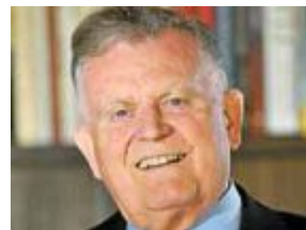
Ministerpräsident a. D. Erwin Teufel