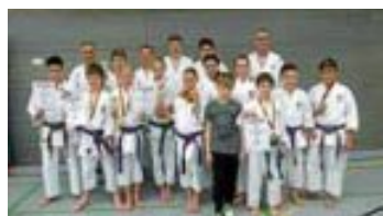
Die deutsche Meisterschaft in Blumberg in Calwer Hand