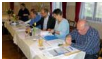
Der Vorstand und Ausschussmitglieder