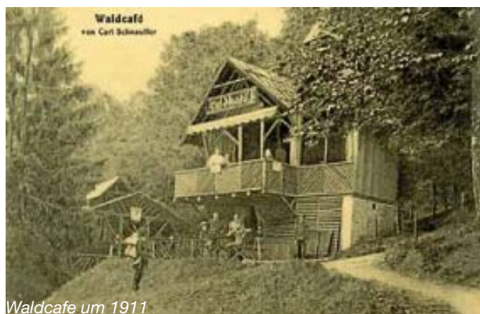
Waldcafé um 1911

Wir starten am Sonntag, den 27. April um 13.30 Uhr am Georgenäum in Calw. Die Führung dauert zirka 2,5 Stunden. Es werden unter anderem die Standorte des alten Krankenhauses und des Waldcafé's gezeigt, diverse Gedenksteine erläutert und über das Wirken des Verschönerungsvereins berichtet und vieles mehr. Lassen Sie sich einfach überraschen! Die Teilnahme ist kostenlos.