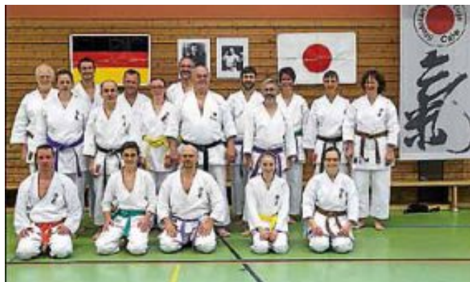
Geschafft, aber glücklich!

Den Abend ließen wir noch in gemütlicher Runde im Mönchswasen in Simmozheim ausklingen.