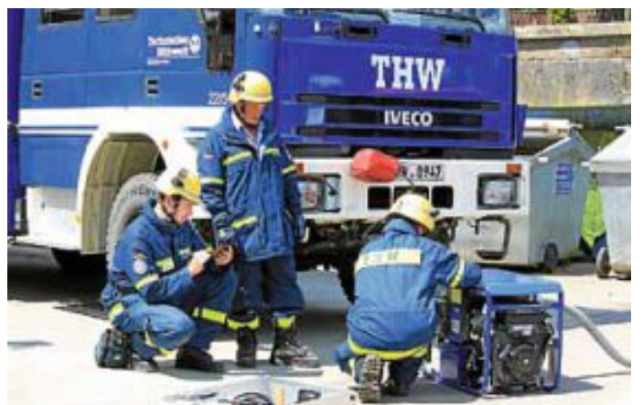
Helferanwärterin und Stationsprüfer am Stromaggregat.

„Alle 17 Helferanwärter haben bestanden!“, so lautete das erfreuliche Ergebnis der Grundausbildungsprüfung, die der THW-Geschäftsbereich Stuttgart am Samstag abhielt. Auf dem Areal des Ortsverbandes Calw hatten die Prüflinge sieben Praxisstationen zu meistern – von der Holz- und Metallbearbeitung über das Bewegen von Lasten und den Umgang mit Schere und Spreizer bis hin zu einer Bergungs-Teamprüfung. Begonnen hatte der Tag früh morgens mit einer schriftlichen Theorieprüfung. Auch hier gaben sich die angehenden Helfer keine Blöße. Insgesamt waren an die 40 THW-Mitglieder aus acht Ortsverbänden im Einsatz, um die halbjährlich stattfindende Veranstaltung zum Erfolg zu führen. Auch die Jugendgruppe des Ortsverbandes Calw zeigte sich von ihrer besten Seite und bewirtete die Prüflinge in den Pausen. Auf die frisch gebackenen ehrenamtlichen Helfer wartet nun die Fachausbildung in ihren jeweiligen Gruppen – und der eine oder andere Lehrgang an der THW-Bundesschule.