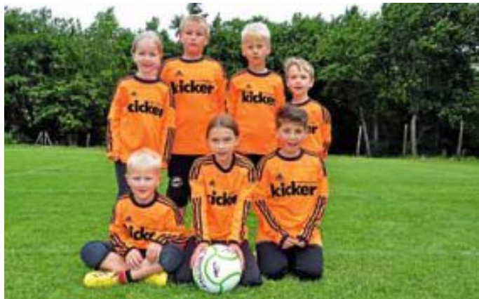
Die jüngsten Calwer Talente der E-Jugend.

Nur Favorit Dennach musste die A-Jugend zum Sieg gratulieren, Silber bei der Württembergischen ging nach Calw. Auch dank eines Siegs gegen den TV Vaihingen/Enz. C-Jugend männlich, Zwischenrunde: Platz 1 bedeutet das Ticket zur Württembergischen Meisterschaft.