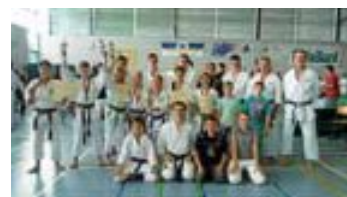
Calwer Karatekas top in allen Altersklassen