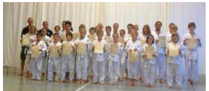
Sehr schöne Prüfung mit tollen Leistungen

Herzlichen Glückwunsch allen Prüflingen. Es war eine schöne Prüfung mit tollen Leistungen.