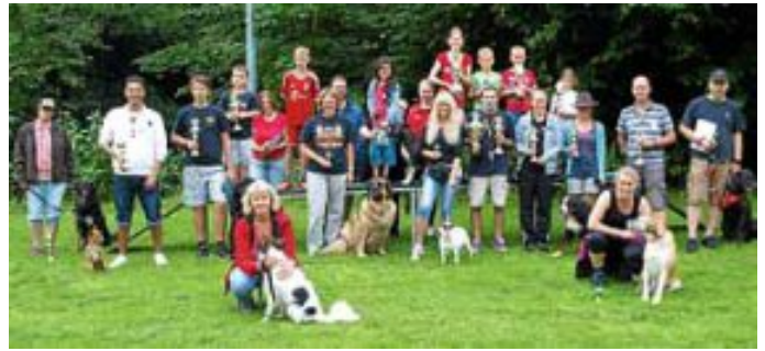
Das Foto zeigt alle Teilnehmer des Calwer Hunderennens.

Im Anschluss an die Siegerehrung, hatte dann auch der Wettergott ein Einsehen und man konnte den Abend beim gemeinsamen Grillen ausklingen lassen.