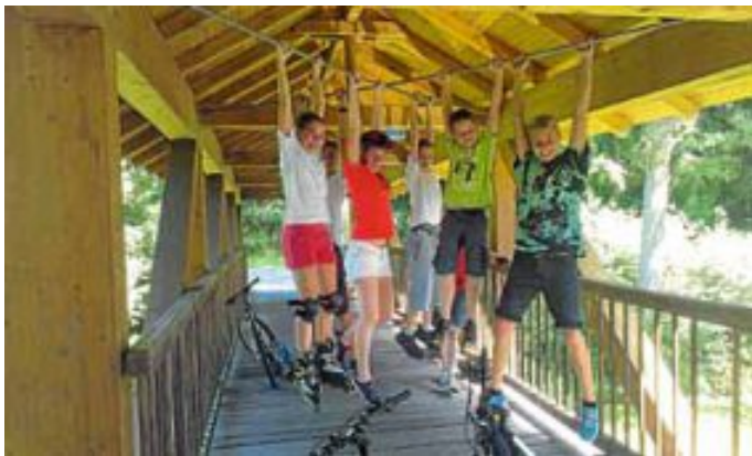
Skate-Pause mit Armtraining

Am vorletzten Samstag hat die Skizunft Calw ihren zweiten Jugend-Eventnachmittag mit allerlei rollenden Untersätzen durchgeführt. Mit dem Zug ging es zunächst von Calw nach Nagold, auf dem Radweg dann wieder flussabwärts bis Station Teinach. Der heiße Ritt auf Longboards, Inline Skates und Mountainbikes wurde durch vielfältige Stopps immer wieder aufgefrischt - so gab es eine Klimmzug-Pause im Schatten einer Holzbrücke, mehrere Getränke- und Eis-Versorgungshaltepunkte oder frisch gekühlte Füße in der Lützenschlucht in Wildberg. Nach einem wilden Anstieg mit anschließender Gelände-Downhill-Einlage erreichte die Gruppe die Ruine Waldeck, wo schon ein Lagerfeuer mit Würstchen wartete. Die Jugend der Skizunft Calw und der Skilehrer-Nachwuchs nutzten das Treffen im Anschluss, um bereits Ideen für die nächste Wintersaison auszutauschen.