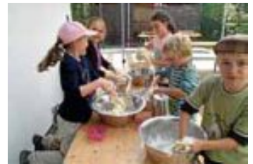
Eifrige Bäckerinnen und Bäcker kneten den Stockbrotteig für den gemeinsamen Abend mit den Eltern