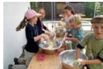
Eifrige Bäckerinnen und Bäcker kneten den Stockbrotteig für den gemeinsamen Abend mit den Eltern

Glücklich und voller Erlebnisse verabschiedeten sich die Kinder vergangenen Freitag vom ersten Abschnitt der Stadtranderholung. An 10 Tagen drehte sich am Jungscharhütte alles um das Mittelalter. Es wurden mittelalterliche Gugel genäht, mit einer früheren Technik Freundschaftsbänder geflochten, Löffel geschnitzt, Schwerter ausgesägt und Schilde bemalt. Für die Beleuchtung wurden Fackeln hergestellt, Jonglierbälle