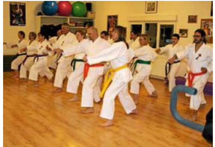
Unsere Mitglieder beim Training

Drei Schnupperstunden sind kostenlos. Am Anfang genügen Jogginghose und T-Shirt. Es wird barfuß trainiert. Weitere Informationen finden Sie unter: www.sk-d-calw.de oder Fon 01 76 / 50 97 53 93