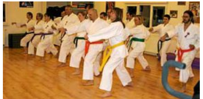
Unsere Mitglieder beim Training

Drei Schnupperstunden sind kostenlos. Am Anfang genügen Jogginghose und T-Shirt. Es wird barfuß trainiert. Weitere Informationen finden Sie unter: www.sk-d-calw.de oder Fon 01 76 / 50 97 53 93