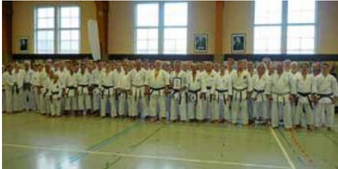
Let's get the party started - aber erst wird trainiert...

Sporthalle Calw, Vorstadtweg 22, Tel.: 07051-926351, www.jka-karate-calw.de