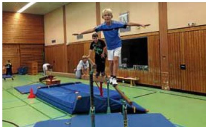
Die KiSS bietet die nötige Balance – zwischen Spiel, Spaß und sportlicher Entwicklung!

Weitere Informationen zur KiSS gibt es zudem aktuell unter www.tsvcalw.de/kindersportschule .