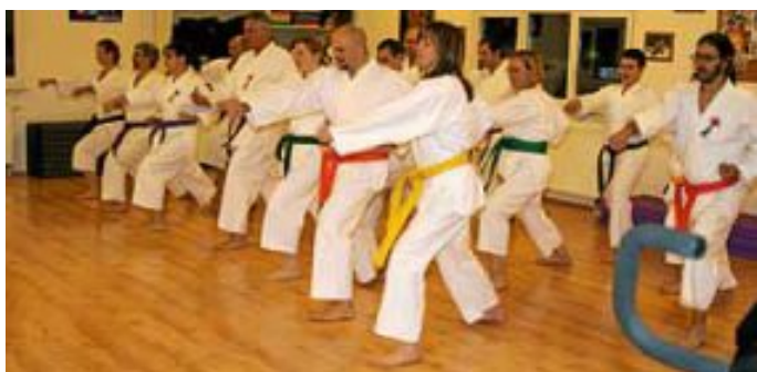
Unsere Mitglieder beim Training

Drei Schnupperstunden sind kostenlos. Am Anfang genügen Jogginghose und T-Shirt. Es wird barfuß trainiert. Weitere Informationen finden Sie unter: www.skd-calw.de oder Fon 01 76 / 50 97 53 93