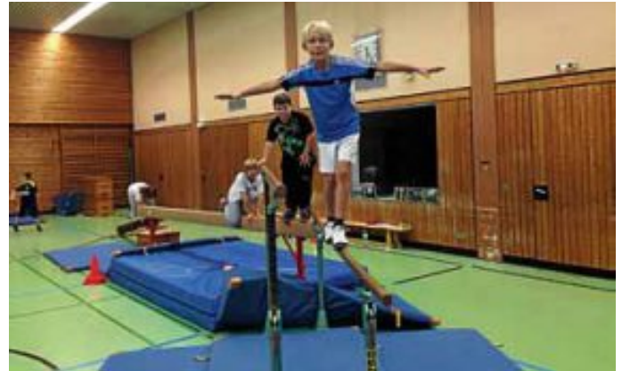
Die KiSS bietet die nötige Balance – zwischen Spiel, Spaß und sportlicher Entwicklung!

Weitere Informationen zur KiSS gibt es zudem aktuell unter www.tsvalw.de/kindersportschule .