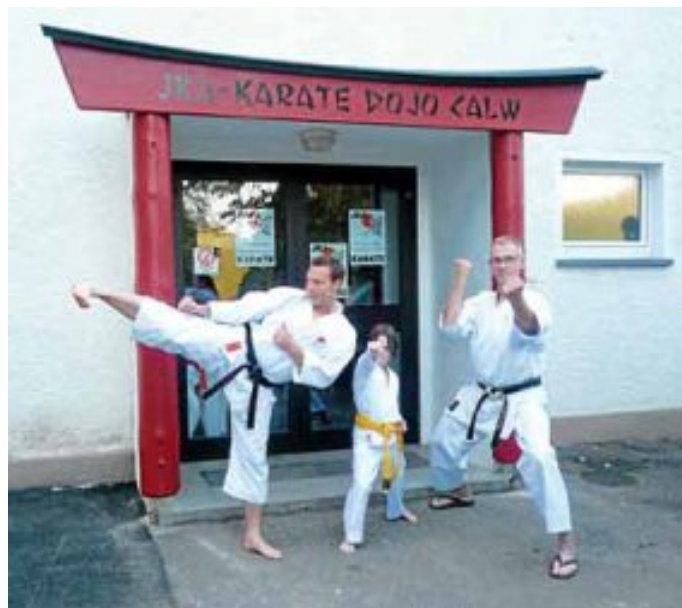
Ab sofort neue Anfängerkurse für Kinder, Jugendliche, Erwachsene und Senioren