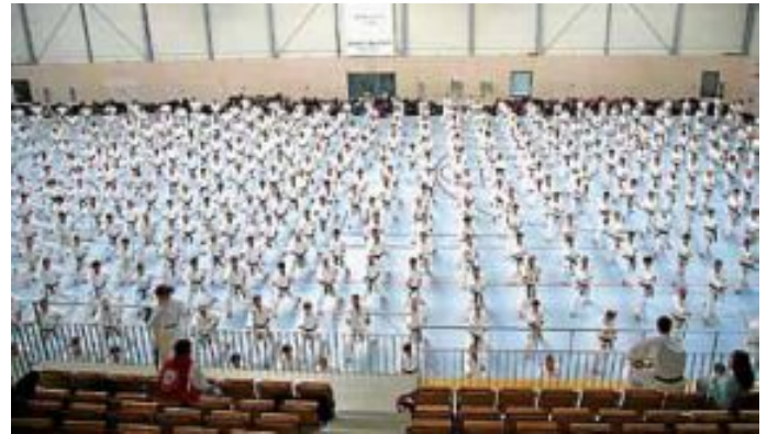
Karate - nicht mehr nur eine Randsportart

Jetzt geht's wieder los mit den neuen Anfängerkursen! Kinder (ab 6 Jahre): freitags, 15 bis 16 Uhr Jugendliche und Erwachsene : dienstags, 18.30 – 19.45 Uhr. Senioren : dienstags, 19.45 bis 21.00 Uhr Trainingsort : Calw-Stadt, Alte Sporthalle, Vorstadtweg 22 Anfänglich genügen Trainingshose und T-Shirt. Infos: Hans-Jürgen Kaun, Tel.: 07051 926351, www.jka-karate-calw.de