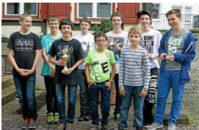
SV Jugend Homepage „ www.schach-sv-calw.de “

Gäste sind herzlich willkommen. Bei Bedarf (ab 4 Interessenten) werden Kurse angeboten. Unser Spiellokal ist das Kaffeehaus Calw, siehe auch unsere