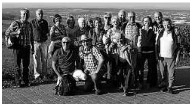
Die TG-Gruppe auf der Burg Steinsberg; im Hintergrund die Rhein-Neckar-Arena

Welch gewaltige Stimmung ein Tor in einem Bundesliga Stadion auslösen kann, erlebten die wandernden Tennisspieler aus Calw. Sie marschierten zufällig in dem Moment, als das 1:0 der TSG Hoffenheim gegen Schalke 04 fiel, an der Sinsheimer Rhein-Neckar-Arena vorbei. Zuvor war das aus nahezu 30.000 Kehlen intonierte Badener Lied zu hören, an dem sich die (wenigen) badischen Mitglieder der TG-Gruppe besonders erfreuten.