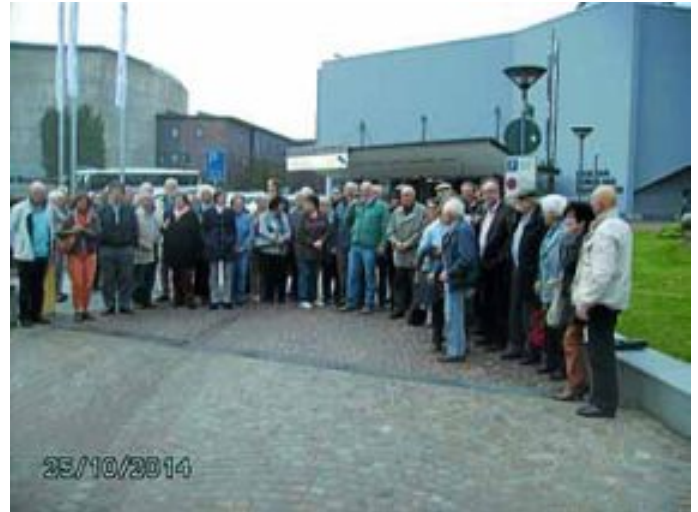
Calwer Teilnehmer vor der Liederhalle