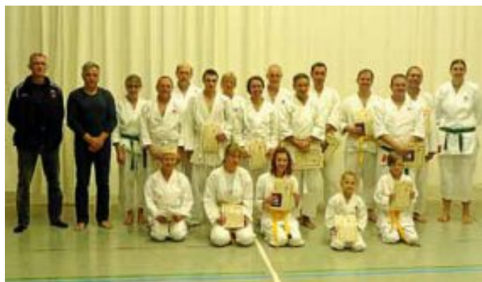
Herzlichen Glückwunsch zur bestandenen Prüfung