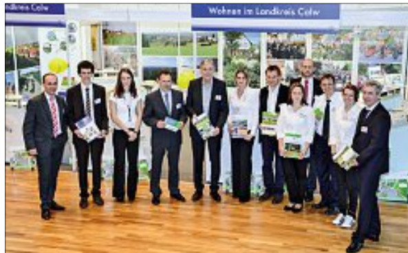
Landkreis und Stadt Calw präsentierten sich gemeinsam

Wenn auch Sie sich für einen Wohnbauplatz in Calw interessieren, dann melden Sie sich bei der