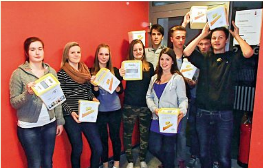
Die fleißigen Sammler mit ihren Sammlerboxen