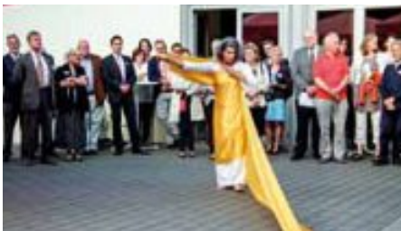
Feier im und vor dem Hirsauer Kursaal