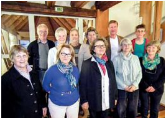
Die Mitglieder der Calwer Hospizgruppe