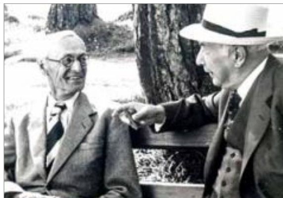
Hermann Hesse und Theodor Heuss

Wie kein anderer deutscher Politiker war Theodor Heuss (1884-1963) ein Mann der Literatur: ob als Redakteur, Biograph, Lektor, Herausgeber, Essayist, Kritiker oder Funktionär. Schon der Gymnasiast begann Korrespondenzen mit namhaften Autoren. Den Weg „ein Literat“ zu werden, verließ der junge Journalist zwar schnell, der Literatur indes blieb Heuss durch zahllose Aufsätze, Rezensionen und Freundschaften mit Autoren bei. Noch der Bundespräsident, der sich immer auch