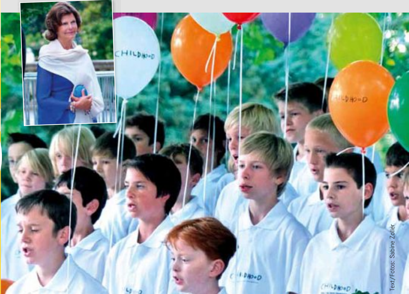
Text/Fotos: Sabine Zoller