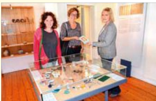
Im Hermann-Hesse-Museum gab es viel zu bestaunen

Der diesjährige Tag des offenen Denkmals stand unter dem Motto „Farbe“. In Calw gab es zu diesem Thema einiges zu sehen. Museen und Kirchen hatten bei freiem Eintritt geöffnet und spannende Führungen standen auf dem Programm. So kamen beispielsweise 156 Interessierte, um einen Blick in den „Langen“ zu werfen. 83 nutzten die Gelegenheit, sich mal im Stadtarchiv umzusehen. 88 Besucher verzeichnete das Palais Vischer, 140 Gäste kamen ins Hermann-Hesse-Museum und 130 ins Hirsauer Klostermuseum. Reges Interesse gab es auch an der im Aufbau befindlichen Museumsanlage des Vereins Württembergische Schwarzwaldbahn Weil der Stadt-Calw. Außerdem nahmen nochmal weit über 300 Besucher an den verschiedenen Führungen teil oder besichtigten die Stadtkirche, die Kirche St. Josef oder die Kirche in Altburg.