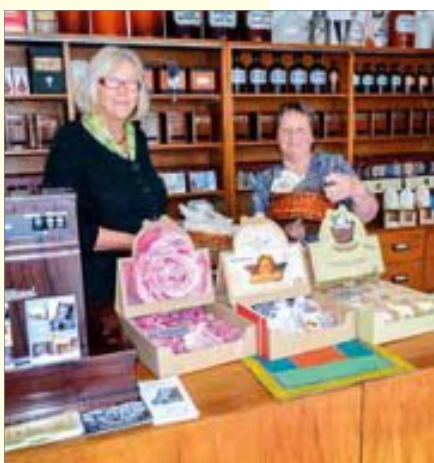
Blick ins Lädle des Gerbereimuseums