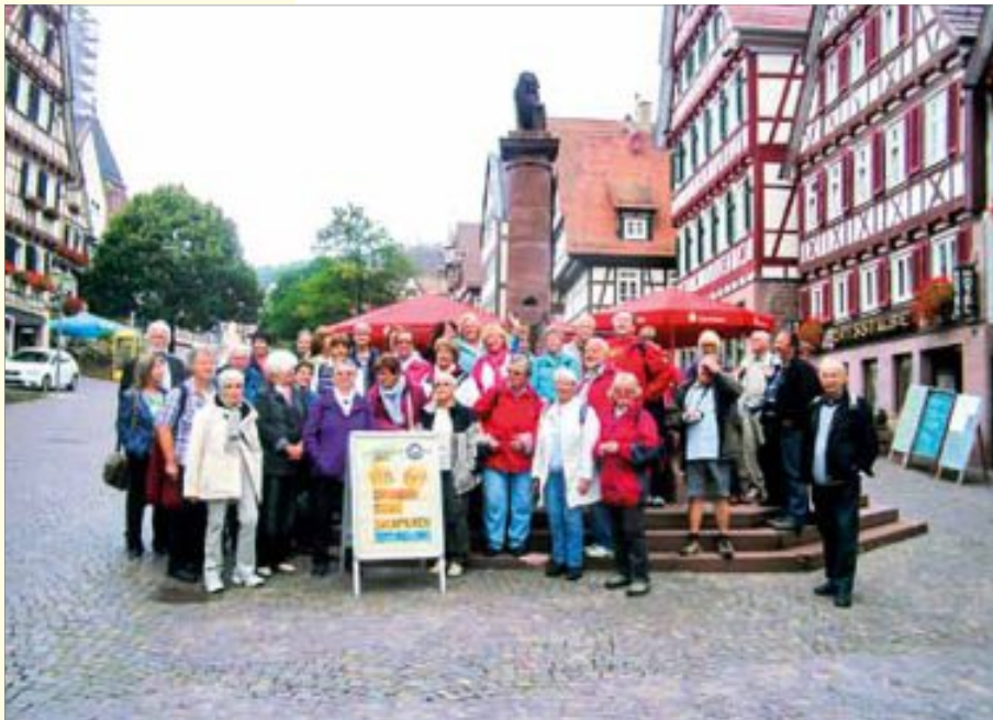
Beliebt waren die Führungen am Tag des offenen Denkmals

Der diesjährige Tag des offenen Denkmals stand unter dem Motto „Farbe“. In Calw gab es zu diesem Thema einiges zu sehen. Museen und Kirchen hatten bei freiem Eintritt geöffnet und spannende Führungen standen auf dem Programm. So kamen beispielsweise 156 Interessierte, um einen Blick in den „Langen“ zu werfen. 83 nutzten die Gelegenheit, sich mal im Stadtarchiv umzusehen. 88 Besucher verzeichnete das Palais Vischer, 140 Gäste kamen ins Hermann-Hesse-Museum und 130 ins Hirsauer Klostermuseum. Reges Interesse gab es auch an der im Aufbau befindlichen Museumsanlage des Vereins Württembergische Schwarzwaldbahn Weil der Stadt-Calw. Außerdem nahmen nochmal weit über 300 Besucher an den verschiedenen Führungen teil oder besichtigten die Stadtkirche, die Kirche St. Josef oder die Kirche in Altburg.