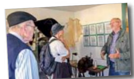
Informationen im Gerbereimuseum