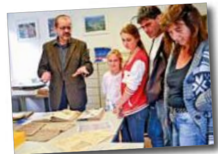
Zu Besuch im Stadtarchiv

Ein Video zum Tag des offenen Denkmals kann auf der Facebook-Seite der Stadt Calw abgerufen werden! www.facebook.com/Stadt.Calw