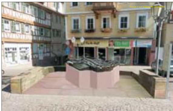
So wie auf dieser Grafik könnte das Innenstadtre Relief am oberen Marktplatz aussehen

In rund 100 Städten im In- und Ausland sind die von Bildhauer Egbert Broerken aus Welver gestalteten Bronze-Reliefs bereits realisiert worden, die es vor allem für blinde Menschen möglich machen, auf Fingerkuppen durch die Straßen spazieren und die Anordnung der Plätze und Gassen zu ertasten. Kleine Punkte in Blindenschrift (Braille) geben Erläuterungen zu Bürgerhäusern, Kirchen, Straßen und Plätzen. Auch in der sehenden Bevölkerung stoßen die Miniatur-Stadtansichten auf große Resonanz. Die Kosten für das Modell im Maßstab 1:250 belaufen sich auf rund 28.000 Euro zuzüglich der Kosten für den Umbau der Pflanzinsel und der Erstellung des Sockels (ca. 10.000 Euro). Finanziert wird das Ganze aus Geldern, die der Stadt von einem anonymen Spender zugeflossen sind.