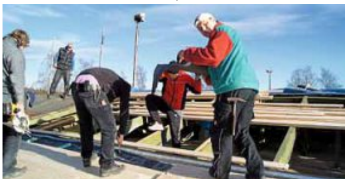
Das Sportheim ist wieder wetterfest!

Nachdem uns der nasse Oktober und November einen Strich durch die Rechnung gemacht hat, konnten wir die milden und vor allem trockenen Tage zwischen Weihnachten und Neujahr für 2 große und einige kleinere Arbeitsdienste nutzen. Das alte Dach wurde abgetragen, die neue Unterkonstruktion aufgebaut und neue Dachrinnen montiert. Teil 2 - die oberste Dachschicht, folgt dann zu einem späteren Zeitpunkt, wenn es die Bedingungen zulassen. Wir bedanken uns bis hierhin für alle tatkräftigen Helfer und alle, die uns bei dieser Aktion durch Geld- oder Materialspenden unterstützt haben.