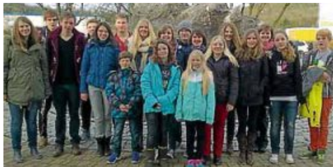
Die Jugendabteilung unternahm ihren alljährlichen Badeausflug ins Aquatoll nach Neckarsulm.