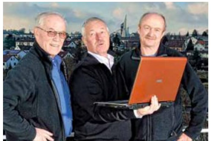
men - power

Kontaktaufnahme per Telefon unter 0175 8484815 oder per E-Mail info@heumaden-aktiv.de