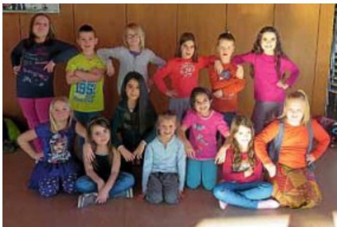
Unsere verrückten und wilden „JELLY BELLYS“ (8-9 Jahre) freuen sich schon auf ihren ersten Auftritt im neuen Jahr

Die Ehre des allerersten Auftritts im Jahr 2014 haben in diesem Jahr die BUBBLES, SMARTIES und JELLY BELLYS. Die Kinder sind zwischen 3 und 9 Jahren alt und werden am kommenden Sonntag, 2. März um 15 Uhr in Stammheim beim Kinderfasching auftreten. Sie werden dort zum ersten Mal ihre neuen Tänze zeigen und das natürlich bunt verkleidet. Die BUBBLES (3-5 Jahre) zeigen einen süß, verzauberten Kindertanz mit aktuellen Chart-Hits, die SMARTIES (6-8 Jahre) tanzen zu einem Mix aus Oldies und aktuellen Songs und die JELLY BELLYS (8-9 Jahre) werden eine verrückte und wilde Choreographie vorführen. Es lohnt sich also, einmal vorbeizuschauen und sich von den Kindern verzaubern zu lassen.