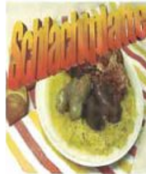
am Samstag, den 08.03.2014 ab 18.00 Uhr im Vereinsheim