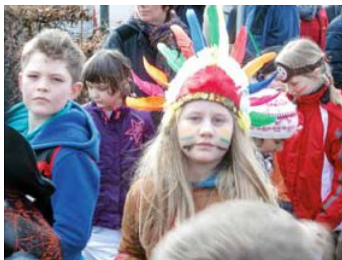
Der Faschingsumzug der Grundschule mit den Kindertageseinrichtungen Alzenberg und Wimberg