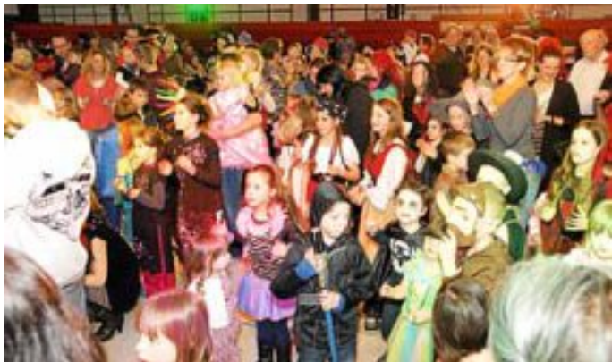
Beim Kinderfasching wimmelte es in der Gemeindehalle von Cowboys, Prinzessinnen und Indianer.