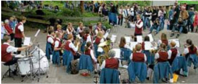
Die Jugendkapelle spielte beim Sommerfest des Sprachheilzentrums.

Der Musikverein startet wieder mit der Ausbildung von Jungmusikern. Vorab laden wir alle Neugierigen und Interessierten zu einer Instrumentenrallye ein. Wir wollen euch zeigen, was es bei uns alles zu lernen gibt und was wir euch darüber hinaus alles bieten. Am Freitag, 27. Juni findet daher um 18 Uhr eine „Instrumentenrallye“ bei uns im Vereinsheim (zwischen Gemeindehalle und Gymnasium) statt. Dort dürft ihr alle Instrumente ausprobieren und die Jugendkapelle zeigt euch, was sie schon können. Der Unterricht beginnt dann noch vor den Sommerferien.