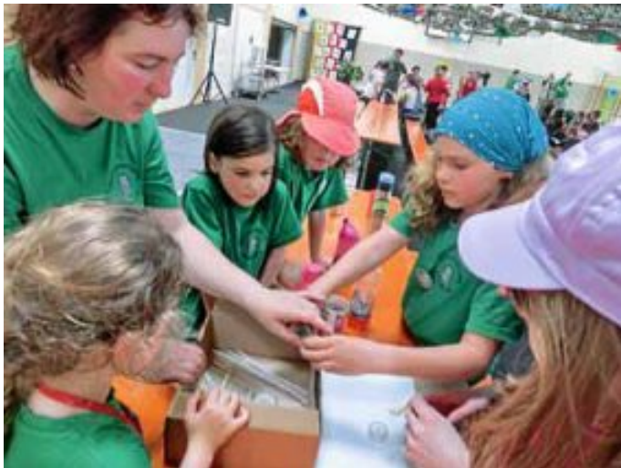
Die Altburger Kinder in Aktion

Nach der Begrüßung begann schon das erste Spiel. Wir mussten ein Ei so verpacken, dass es nach einem Dachsturz unten wieder heil ankam. Am Sonntag stand wieder die beliebte Lagerolympiade an, die wir gemeinsam mit St. Georgen meisterten und den 6. Platz erreichten. Das Wetter war schön warm und so war das Highlight für unsere Kinder, das große Planschbecken auf dem Zeltplatz. Am Montag gab es noch das Abschlussspiel, die Kinder durften die Jugendleiter nass machen und umgekehrt, zum Schluss wurden die nassen T-Shirts gewogen und die Jugendleiter haben gewonnen. Nach der Verabschiedung fahren wir glücklich und zufrieden wieder nach Hause. Es war ein schönes, heißes Zeltlager.