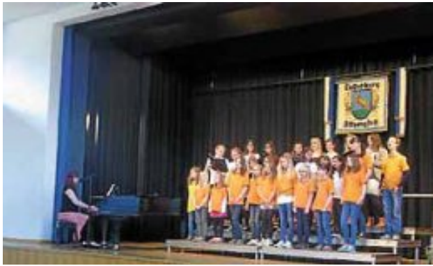
Gemeinsamer Auftritt mit den Jubilaren

Am 18. Mai waren unsere Liederkranz Spatzen in Althengstett zu den Feierlichkeiten anlässlich des 150-jährigen Bestehens eingeladen. Es trafen sich Kinder- und Jugendchöre aus dem Hermann-Hesse-Chorverband, die in den letzten Jahren so wie unsere Spatzen mit dem dortigen Jugendchor zusammengearbeitet haben. Unsere Spatzen brachten unter anderem eine Kostprobe aus dem aktuellen Musical Zirkus Furioso zum Besten. Abschließend wurde natürlich ein Lied aus unserem gemeinsamen Repertoire gesungen und auf diesem Wege herzlich gratuliert.