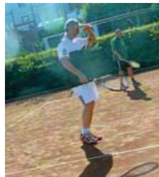
Diese Handballer können auch Tennis