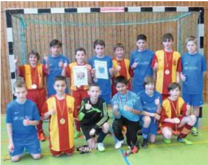
Die stolzen D1-Teams aus Calw und Altburg nach der Medaillenübergabe