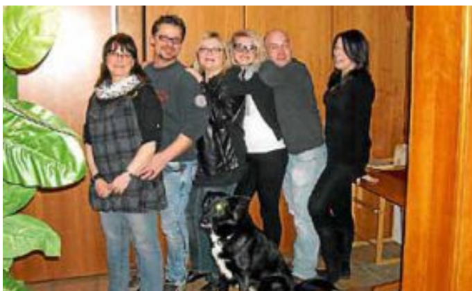
Die neue Vorstandschaft