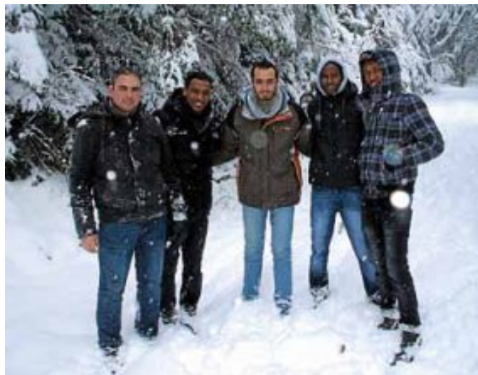
Ihr erster Schnee

Nach dem Mittagessen im Wirtshaus zum Löwen hat sich die Gruppe auf der Kegelbahn noch einmal gründlich aufgewärmt. Gegen Abend, wieder an der Unterkunft, gab es glückliche Gesichter und Abschiedsworte wie: „Das war ein schöner Tag!“