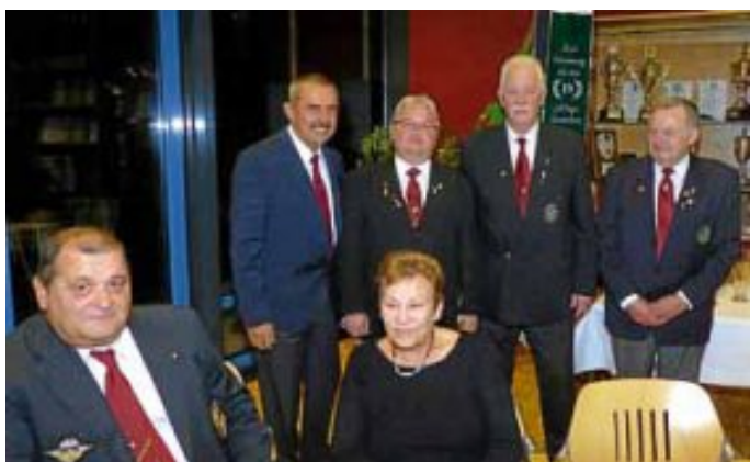
Neuer Vorstand mit französischen Freunden

Wir treffen uns zur ersten monatlichen Sitzung des Jahres, am Dienstag, den 13. Januar, 18 Uhr im Triebgebäude der Graf-Zeppelin-Kaserne.