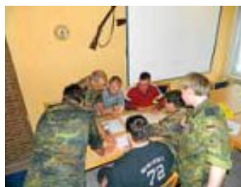
Kameraden beim Ausarbeiten der Lage

Unter Zuhilfenahme der Taschenkarte „Fernmelden“ klappte es schließlich bei den meisten Kameraden nahezu fehlerfrei.