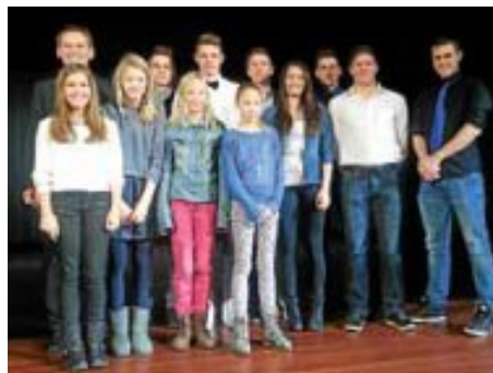
Sportlerehrung für die erfolgreichste Mannschaft auf der Deutschen Meisterschaft