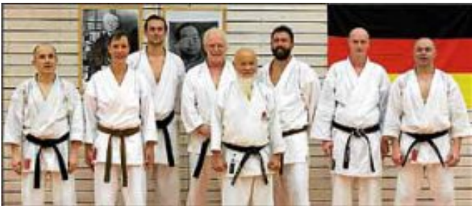
Der Meister und die sieben Samurai aus Calw

Das Training war in beiden Einheiten von Unter- und Oberstufe sehr gut besucht, die Halle platzte jedenfalls beinahe aus allen Nähen. Vom blutigen Anfänger bis zum Nationalkämpfer waren alle denkbaren Leistungsklassen vertreten. Es ist schon eine tolle Atmosphäre, wenn ein paar hundert Karateverrückte gleichzeitig zu Werke gehen, sei es im Basis- (Kihon) und Partnertraining (Kumite), das im ersten Durchgang im Vordergrund stand, oder im Katatraining, das im weiteren Verlauf anstand. In der Pause konnte man sich im Foyer der Halle bei Essen und Trinken bei einem kleinen Plausch regenerieren. Wieder einmal ein gelungener Start ins Karate-Jahr, der in diesem Jahr bereits zum 18. Mal stattfand.