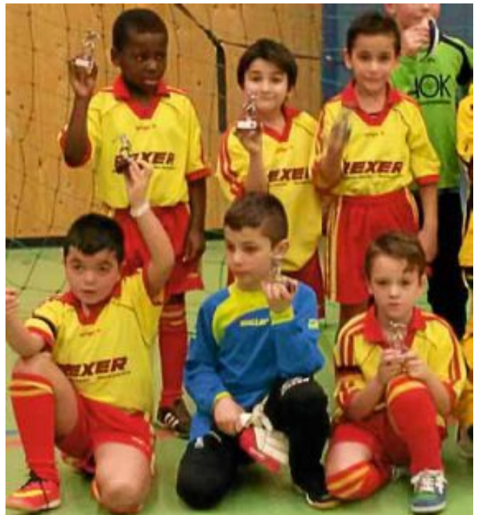
strahlende Gesichter bei der F2

Beim F2-Turnier erreichten unsere Jüngsten einen tollen 3. Platz. Nach den Gruppenspielen als Zweiter platziert, verloren sie unglücklich das Halbfinale gegen Aidlingen mit 1-2, im kleinen Finale gegen Althengstett trumpten sie dagegen auf und gewannen mit 2-1.