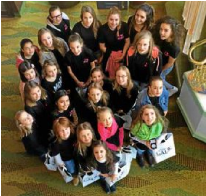
Die frisch geehrten Lil' Sweet's und KOOL KIXX