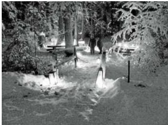
So romantisch war's am Brünnele