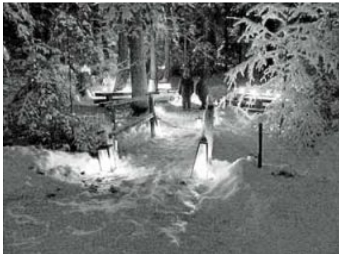
So romantisch war's am Brünnele