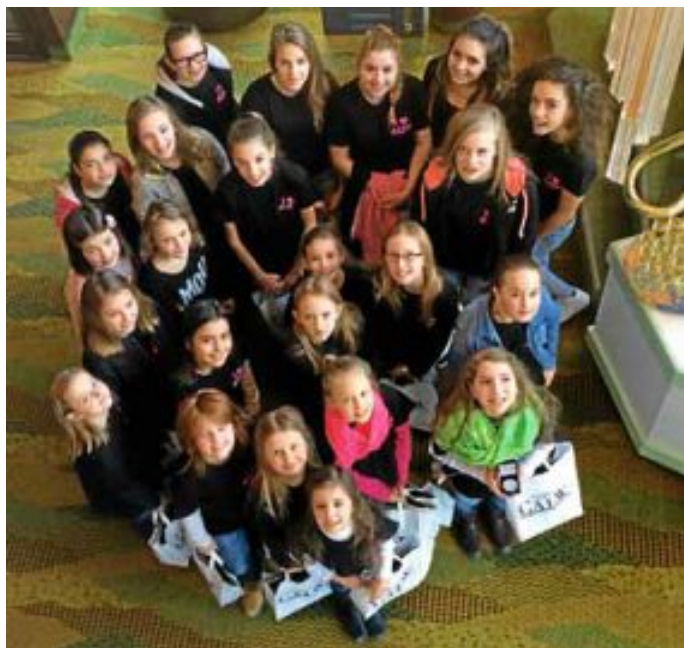
Die frisch geehrten Lil' Sweet's und KOOL KIXX