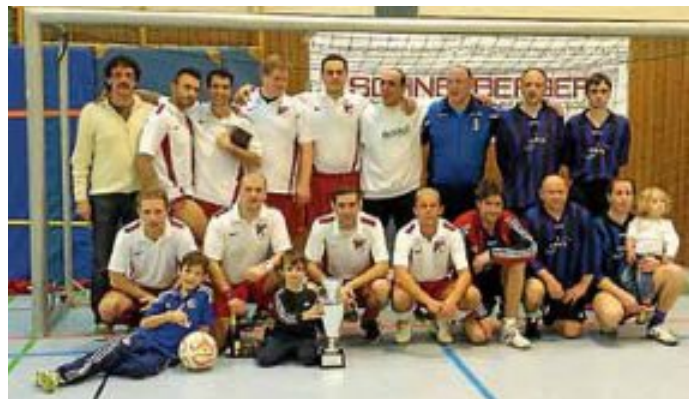
Somit bleibt der Wanderpokal zumindest ein weiteres Jahr in Hirsau. Glückwunsch!

Am Samstag, 10.01. gelang unserer AH-Mannschaft, nach 2014, bereits zum zweiten mal in Folge der erste Platz beim Ü30-Turnier des SV Wildbad. Mit vier Gruppensiegen und einem Unentschieden, sicherte sich unsere Mannschaft, als einziges ungeschlagenes Team, souverän den ersten Platz.