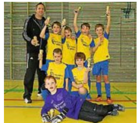
F1 gewinnt Turnier in Pfalzgrafenweiler

6 Siege am Stück und der Tag war gerettet. Im Endspiel mit einem überzeugenden 4:0 gegen den SSV Waldorf/Rohrdorf setzten unsere Jungs den Schlusspunkt unter ein Klasse Turnier.