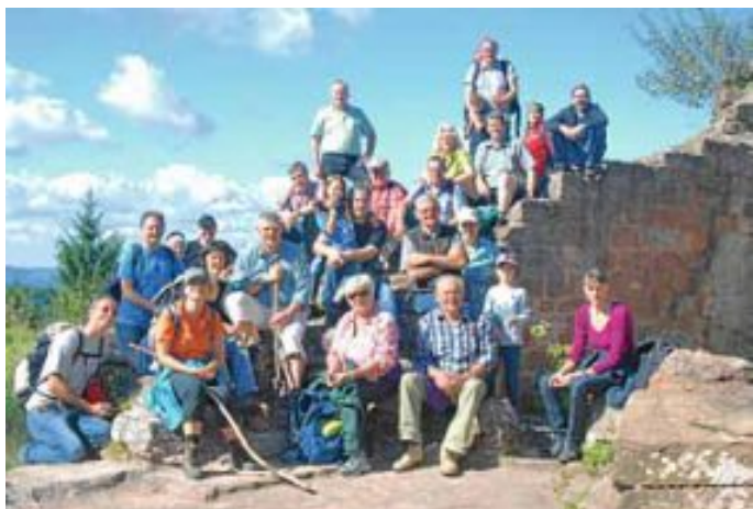
MVC auf der Burgruine Hohenbourg

Dazu kam der Whiskeystand am Fleckenfest, ein Reifenmontier-Workshop, Grillfest Adlerhorst und erstmals eine Familienaktion ohne. Fast ein ganzer Bus voll Jung und Alt wanderten zur Burg Fleckenstein in der Pfalz.