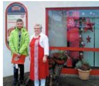
Ein Schüler aus der 9. Klasse der Wimbergschule am Bewerbungstrainingstag bei der Firma Metzgerei Blum