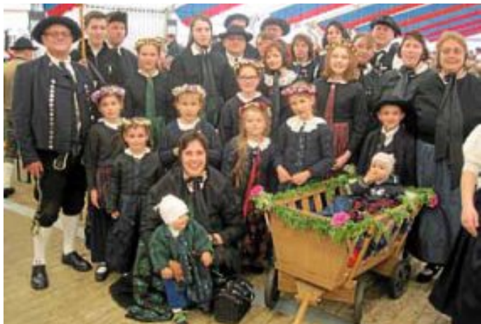
In voller Montur

Vergangenen Sonntag war die Trachtengruppe zum Umzug laufen in Leidringen. Nach einer ca. einstündigen Busfahrt kamen wir mit 30 Trachtlern an. Wir hatten noch Gelegenheit uns zu stärken, bevor wir zum Aufstellungsplatz gehen mussten. Dort waren wir froh, dass wir unsere Schirme dabei hatten, denn es begann heftig zu regnen. Es hörte aber als wir loslaufen mussten wieder auf, so dass wir trocken im Hauptes im Festzelt wieder ankamen. Wer wollte, konnte jetzt Karussell und Boxauto fahren, bevor die Rückreise angetreten wurde.