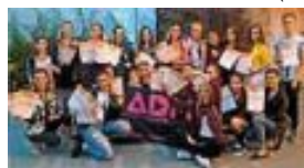
ReverseIT (Juniors 2)

Am Sonntag, 9 Uhr begannen zuerst die Formationen Mc Dreamies* und Lil Sweets, am Mittag dann folgen Solos und Duos. Nach langem Zittern & großer Nervosität, ertanzte sich die Gruppe ReverseIT den 1. Platz (A-Reihe), die Lil Sweets den 6. Platz (M-Reihe) und die Mc Dreamies* den 4. Platz (M-Reihe).