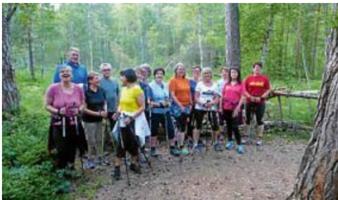
Teilnehmer am Sonnwendlauf

Am Montag trafen sich an der Schwarzwaldhalle 15 Nordic Walker und Walkerinnen zum, mittlerweile schon traditionellen, 6. Sonnwendlauf des Lauftreffs Altburg. Dieses Jahr unter dem Motto „Rund um Altburg und durch den Würzbacher Wald“. Bei bestem Laufwetter startete die Gruppe in Richtung Weltenschwann. Dort wurde der kurze Anstieg in Richtung Röttenbach in Angriff genom-