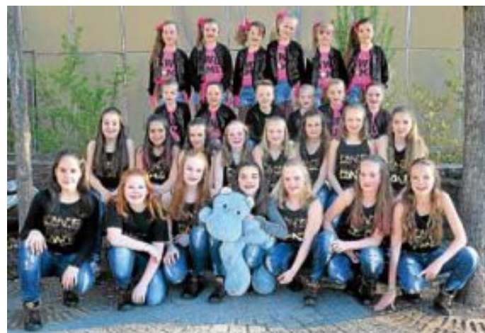
oben Mc Dreamies* unten LIL SweeTS