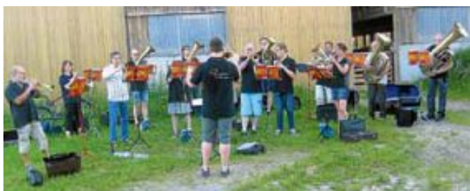
Das war "Brass uff d'r Gass" 2016 in Oberriedt

16.30 Uhr Jungbläser 19.30 Uhr Posaunenchorprobe