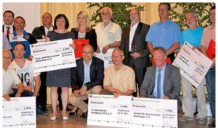
Preisverleihung vom 1. Juli in Enzklösterle

Freudige Post gab es vor einigen Tagen von der Sparkasse, verbunden mit einer Einladung zur Feier-Veranstaltung des Sportkreises